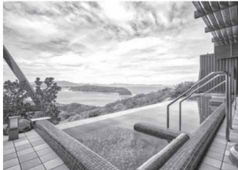
宿泊先露天風呂イメージ写真